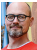
Moderator: Norbert Parzinger Fachredakteur, JUVE Verlag